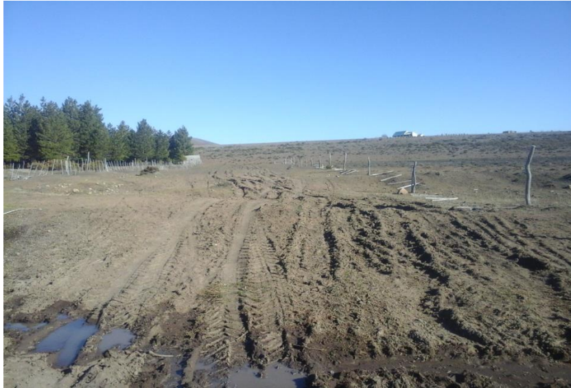
Descripción: Estado actual del acceso a los corrales.