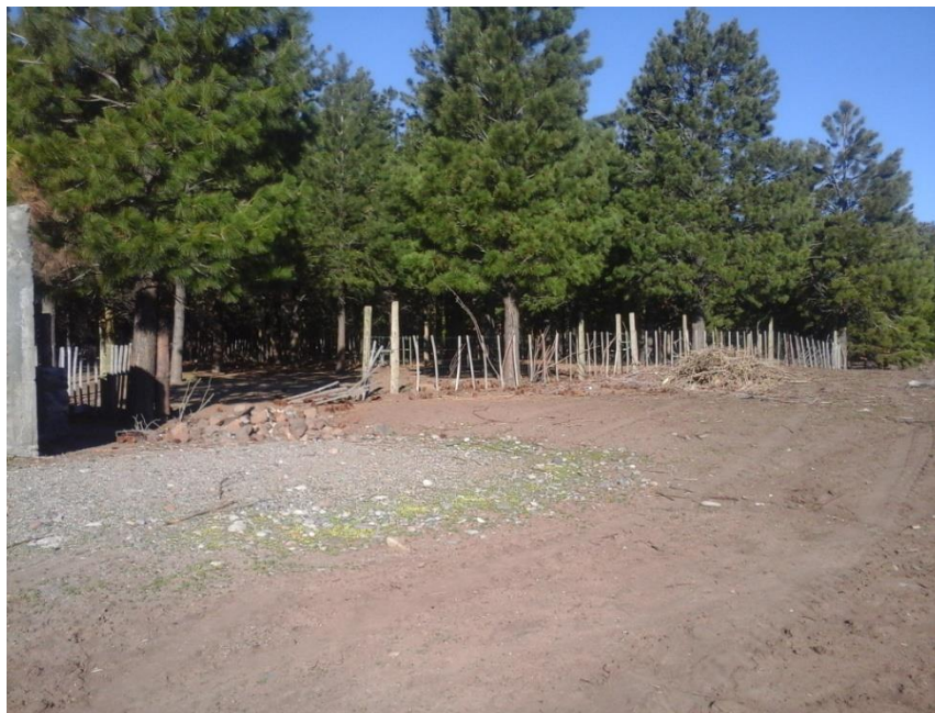
Descripción: Corral existente, al cual se le sumaría la manga y el cargadero.