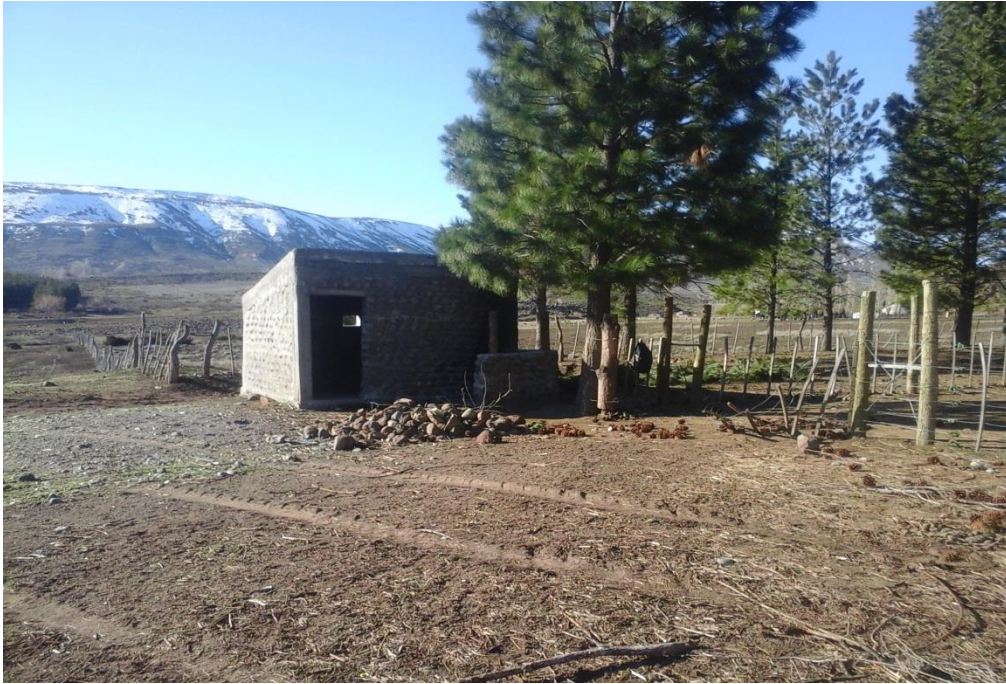
Descripción: Refugio contiguo al corral